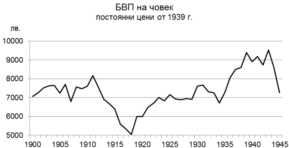
Фигура 2. Брутен вътрешен продукт на човек от населението в България, 1900 – 1945 г., в лв. по постоянни цени от 1939 г.

Скромният икономически растеж не успява да повиши осезаемо благосъстоянието на българите, тъй като е съпътстван от демографска експанзия със сходни параметри. Населението на страната се увеличава от 3,74 млн. души през 1900 г. до 6,97 млн. през 1945 г., което се равнява на годишен прираст от 1,4%. В дългосрочен план икономиката едва успява да догонва нарастването на населението, което води до реален и траен спад в благосъстоянието вследствие на войните. Необходими са почти две десетилетия след Първата световна война, за да бъде надхвърлено едва през 1937 г. нивото от предвоенната 1911 г. (фиг. 2).