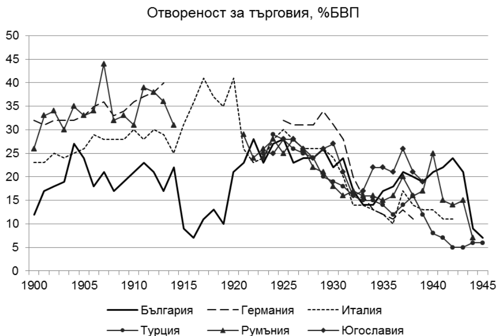
Фигура 3. Индекс на търговска отвореност на икономиката, процент от БВП

Средните стойности на съотношението на вноса и износа спрямо БВП за Европа през 1900 г са 32% и съответно 37% за 1913 г. (Ortiz-Ospina & Roser, 2017). Средната стойност за периода 1900 – 1911 г. за България е 20%, с максимален външотърговски оборот като дял от БВП от 27% през 1904 г. (фиг. 3).