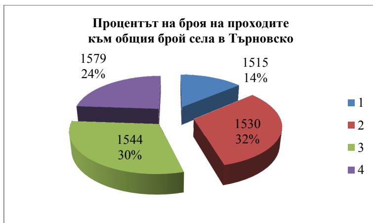
Диаграма 1. Съотношение между броя на приходите и селата в Търновска каза

От казаното до тук можем да заключим, че в началото на изследвания период селата, обозначени като дервенджийски са 5 и техният процент към общия брой села е 14%. Докато през 1579 г. е 24%. В началото на периода това са селата Габрово, Кривина, Къпинова, Илина и Гъбян. Всичките тези села са част от казата или нахията Търнови на вилаета/ливата Никболи. През целия изследван период те запазват статута си на дервенджийски села, но през 1579 г. и по-късно Габрово и Гъбян не спадат към Търновска нахия, а са вече в границите на нахията Хоталич 45 . Докато в средата на XVI век село Кривина е със статут на дервенджийско село в Търновска нахия, то губи този статут през 1579/1580 г., но продължава да принадлежи на нахията Търнови. Също е положението на Кривина и през 1613/1614 г. 46 Диаграма № 1 показва процента на броя на селата-проходи по отношение на общия брой села в Търновска каза/нахия според различните години на регистрацията.