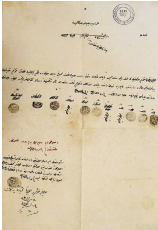
Изображение 2. Мазбата (доклад) на администрацията в Тулча до управлението на Дунавския вилает за дадени 25 000 гроша в кайме за покупки за войската. Дата: 9 окт. 1876 г. НБКМ, ОС, Тч 51/30, л. 1 – лице.

за делата на сарафите и еснафите в променението и купуванието на кайметата с пари, но в правителствените каси и помежду хората трябва да са пазат отредените им цени в зиманието и даванието“. 33 В началото на 1877 г. отново „Дунав“ пише, че според разпоредбите каймето трябва да се приема в номинал от правителствените институции. 34